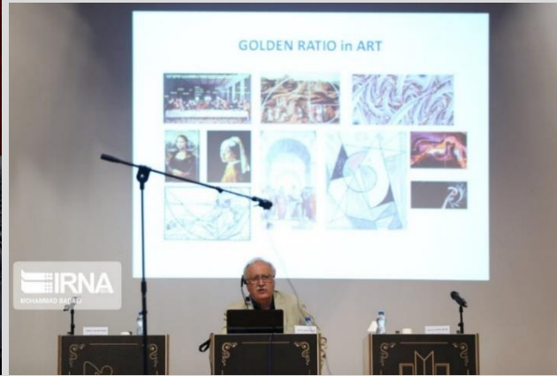
بانسنگ خیرنگاران پویا