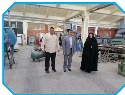
(عج) در دانشکده فنی و حرفه ای

انقلاب اسلامی بازدید کردند. شایان ذکر است که این پروژه به همت دانشجویان رشته جوشکاری دانشکده فنی و حرفه ای انقلاب اسلامی و با نظارت استادان راهنما آغاز شد که در این راستا، بیش از ۶۰ تخت خواب دوطبقه ویژه سرای دانشجویی با اعتباری حدود ۲۰۰ میلیون تومان ساخته شده و به مرحله بهره برداری می رسد.